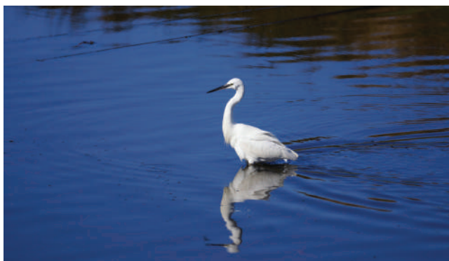
ESTUÁRIO DO CÁVADO