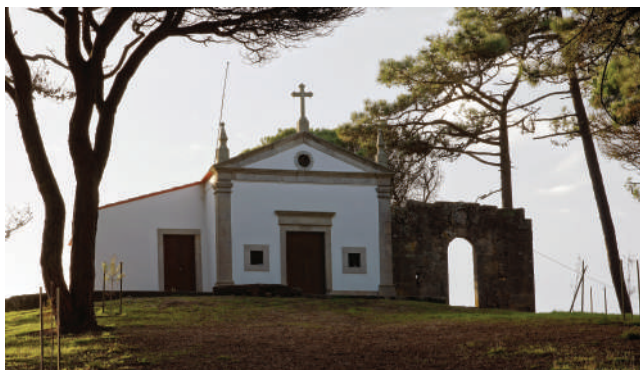
CAPELA E FACHO DA BONANÇA