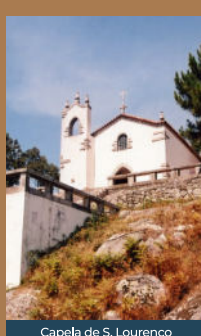
Capela de S. Lourenço

O território de Esposende possui uma série de miradouros naturais situados no alto dos montes reconhecidos como bons locais de observação da paisagem e contemplação. Implantados em locais de altitude mais elevada, entre os 140 a 231m de altitude, estes permitem a visualização de grandes áreas e poderemos, com recurso ao Painel de Leitura e Interpretação da Paisagem, identificar os Pontos de Interesse mais significativos observados desde cada um destes locais. Conhecer o território, apreciar seus locais de interesse e ficar a conhecer Esposende e sua diversidade patrimonial, são os principais objetivos de uma série de equipamentos e estruturas, estrategicamente situados. Para além destes miradouros naturais, existe uma série de sítios de Interesse patrimonial, natural, arqueológico e histórico, ligados por cerca de 140 quilómetros de trilhos, integrados na Rede de Percursos Pedestres do Município de Esposende. Ainda no Parque Natural do Litoral Norte (PNLN), encontramos um conjunto de estruturas, integradas na Rede de Observatórios da Natureza, que permitem a observação da biodiversidade existente. Palcos para estes Miradouros, Observatórios e Torres de Observação, são os estuários do Cávado e Neiva, onde muitas espécies de aves ali param para se alimentarem e posteriormente seguirem viagem.