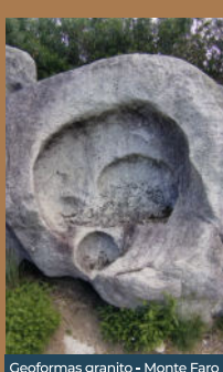
Geofomas granito - Monte Faro