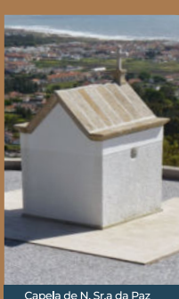
Capela de N. Sr.ª da Paz